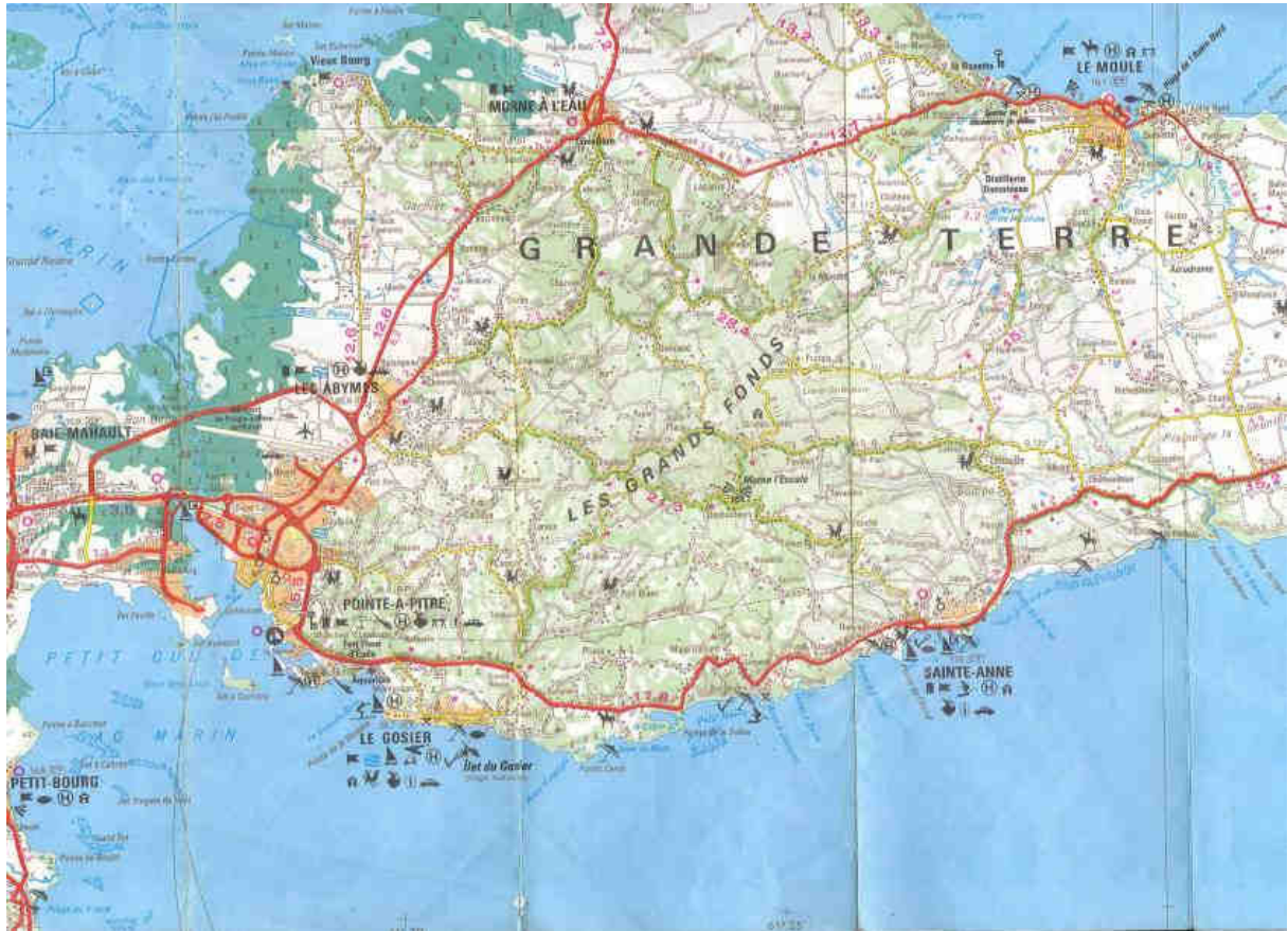
Les Grands fonds de la Grande-Terre

Ce qui est vrai, c'est qu'ils ont longtemps vécu en endogamie, se mariant entre un petit nombre de familles, sans mélange avec la population noire, ce qui explique que plusieurs soient très pâles, avec des cheveux blond clair et certains même albinos. Dans la Grande Terre de la Guadeloupe où, sur le plateau calcaire du nord, il y avait de grandes habitations (plantations) appartenant à de riches familles qui possédaient de nombreux esclaves pour travailler dans les champs de canne à sucre, les "Blancs-Matignon", au sud, dans les Grands-Fonds, région vallonnée et escarpée, était des "petits-blancs", exploitant eux-mêmes leur bien sur les flancs des mornes, sans esclaves. Mais ils n'étaient pas misérables.