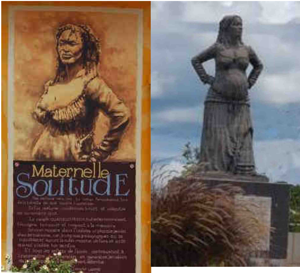
Une école et une statue

Après son arrestation, elle est condamnée à mort. Le lendemain de son accouchement, le 29 novembre 1802, elle fut exécutée. »