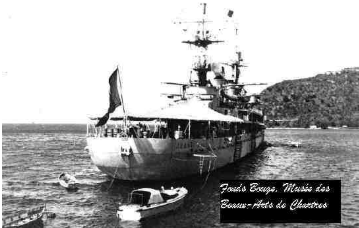
La Jeanne en rade des Saintes

Autre légende, du XXe siècle cette fois, répétée dans la Royale et jusque par les plus hauts gradés : les midships du navire-école "Jeanne d'Arc" auraient contribué à "éclaircir" le teint des Saintois lors des fréquentes escales du navire aux Saintes ! Que les Saintes soient une des escales favorites de la Jeanne, c'est vrai. Nous avons relevé, sur un site Internet qui dresse la liste de ces escales, 16 passages aux Saintes sur 40 années, entre 1964 et 2004. Mais les midships devaient faire vite : ces escales duraient de un à trois jours en général, à l'exception d'une de 7 jours et une de 10 jours. Or un prêtre des Saintes a eu la curiosité de consulter les registres des baptêmes : pas de pic de naissance 9 mois après les passages de la Jeanne !